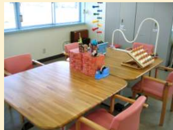
手工芸・上肢や手指の機能訓練