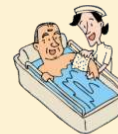
特殊浴槽で身体の不自由な 方でも大丈夫 →