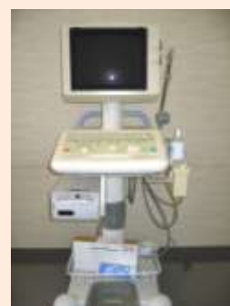
超音波画像診断装置