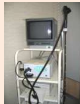
胃ファイバースコープ