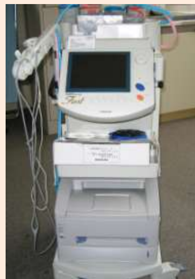
血圧脈波検査装置