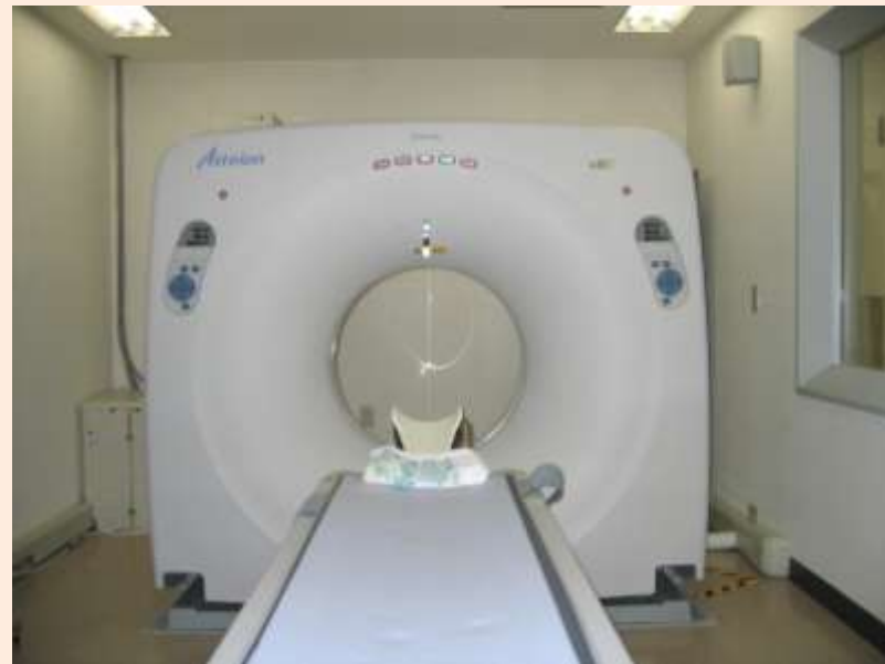
CTスキャン (断層撮影)