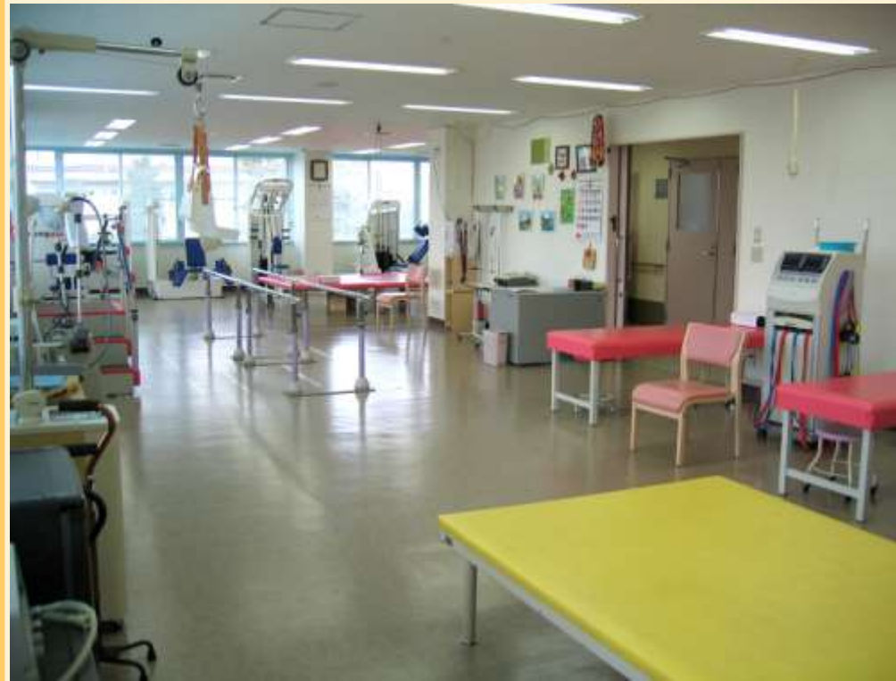
温かい太陽の光を浴びて、機能回復!