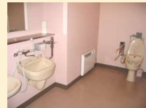
広々とした空間。 オストメイト完備で安心☆