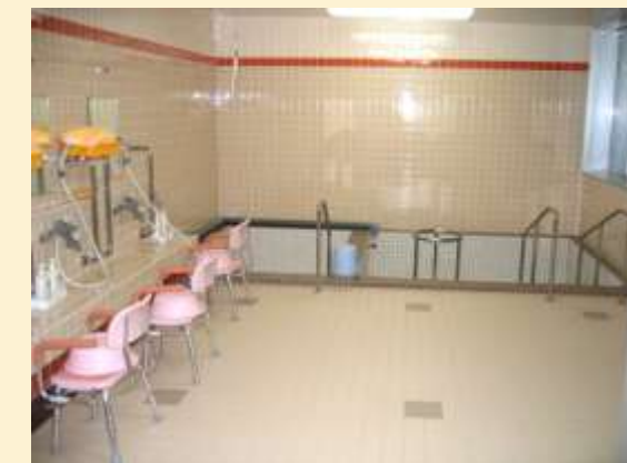
← 一般浴室 患者さまの楽しみは入浴です